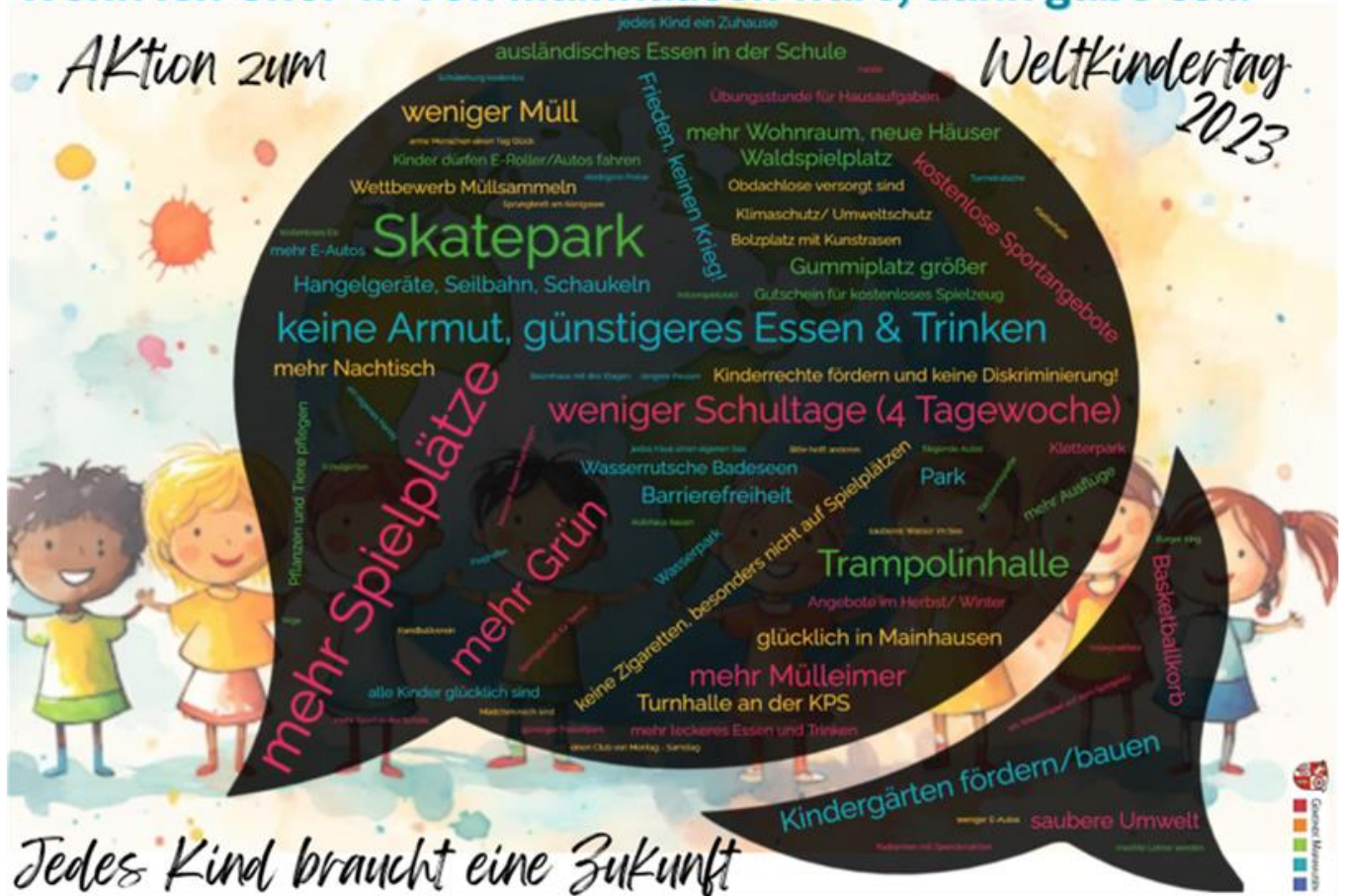
Wortwolke zur Umfrage am Weltkindertag 2023 "Wenn ich Chef*in von Mainhausen wäre, dann..."

Für die Teilnahme an der Aktion zum Weltkindertag 2023, unter dem Motto „Jedes Kind braucht eine Zukunft“, möchten wir uns herzlich für die Kooperation der Mainhäuser Schulen bedanken.